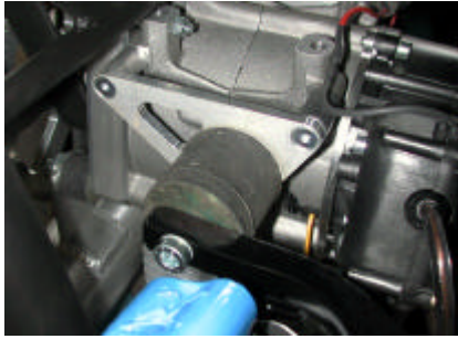
Puffer am Kurbelgehäuse Monster

Die folgenden Bilder zeigen den Einbauort dieser Puffer an den verschiedenen Motoren. Am Flyke sind die 4 Puffer zwischen Motorträger und A-Rahmen betroffen.