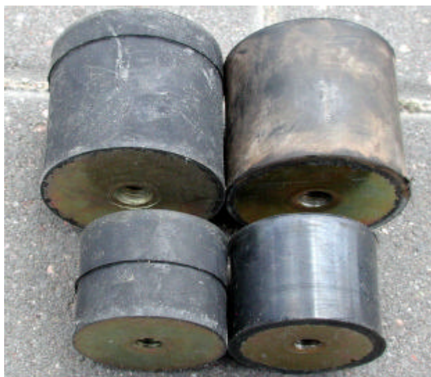
Puffer sicher (links), und unsicher (rechts)

Die Puffer Ø40xHöhe 30 werden am Motorträger des Flykes eingesetzt (je 4 Stück) und am Zylinderkopf und am Getriebe des Simonini-Motors (maximal 3 Stück, typischerweise nur 1x oben).